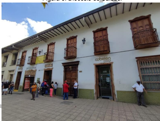
Figura 8. Diócesis de Caldas.