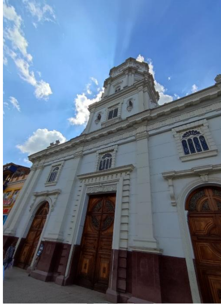
Figura 2. Iglesia Nuestra Señora de las Mercedes.