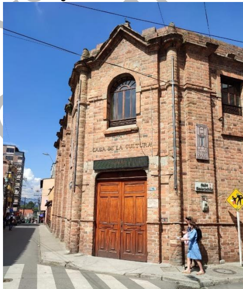
Figura 7. Casa de la cultura.