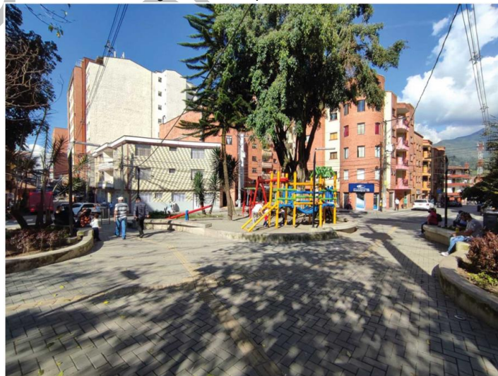
Figura 17. Parque El Carrusel