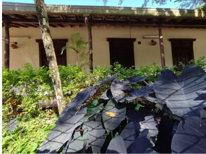
Figura 5. Museo de la Cerámica.

Fuente: Imagen tomado en trabajo de campo.