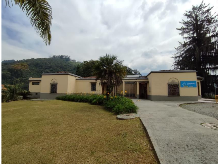
Figura 13. Antiguo Instituto Campesino