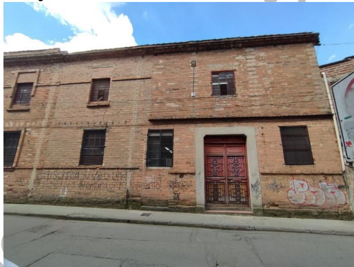
Figura 4. Institución Educativa Pedro Luis Álvarez Correa.