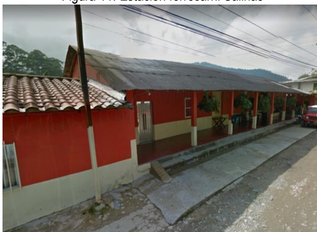
Figura 11. Estación ferrocarril Salinas

Esta estación servía como punto de embarque de maderas explotadas en el sector y los productos agrícolas que durante la primera mitad del siglo XX se producían en el municipio.