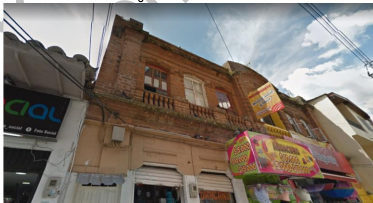
Figura 14. Café Arduino

Este edificio se encuentra sobre la antigua calle Colombia, esta estructura es de principios del siglo XX, posee una arquitectura de tipo republicana, los materiales utilizados en esta construcción son; ladrillo tipo español, calicanto y maderas propias de la región como comino, roble y cedro negro, este inmueble durante los años 30 fue un café utilizado para encuentros de tertulia de los caballeros de este municipio, dado que por el mismo período existió en el marco de la plaza el salón Minerva y este era para un tipo de población más erudita, la contrapropuesta para el resto de la población fue la creación de este café un poco más popular, en este momento el espacio es utilizado como vivienda y ha tenido varias reformas en su primer piso destruyendo las tapias que dividían los salones internos, dejando solo el frontis con sus divisiones en ladrillo y los detalles del trabajo de este, con el Arduino se inició en el primer piso una barbería y una dentistería de hermanos Correa.