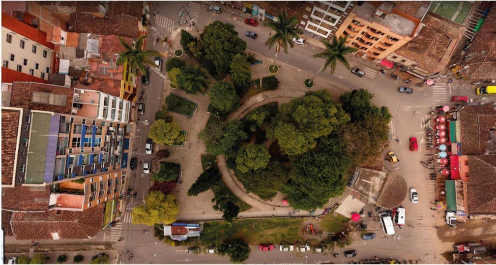
Figura 16. Parque Santander

Es importante rescatar que éste bien inmueble representa una arquitectura popular de gran escala, de allí la importancia de incluirlo como bien inmueble de valor patrimonial.