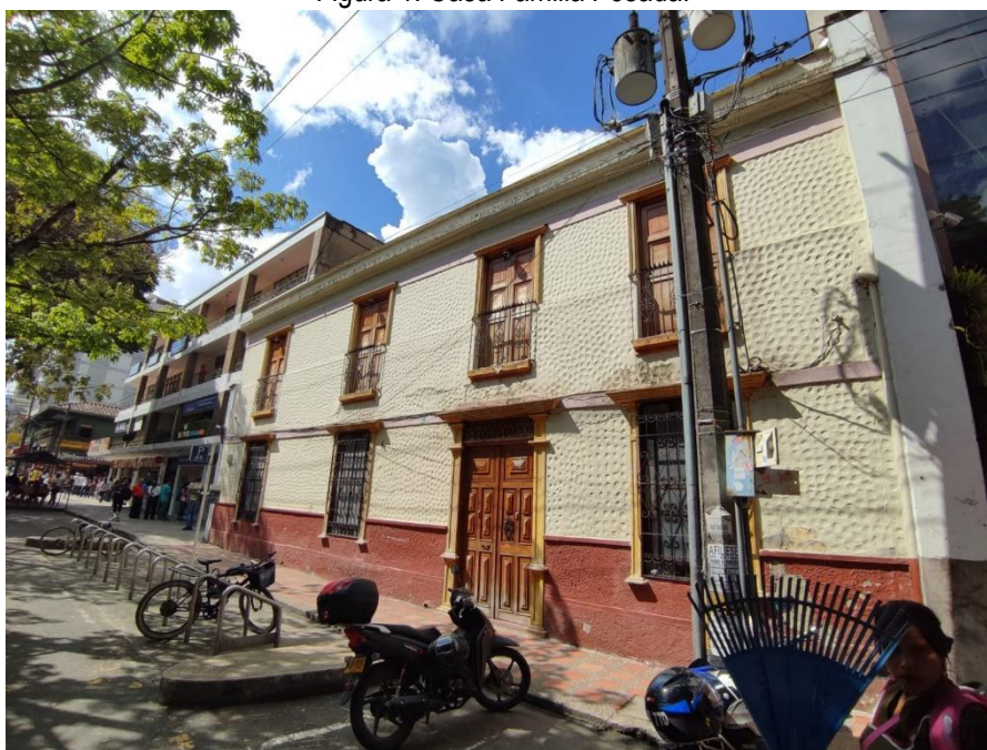
Figura 1. Casa Familia Posada.