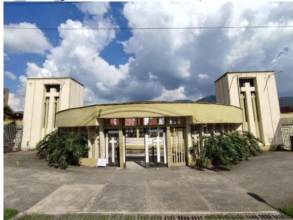
Figura 3. Cementerio Municipal.