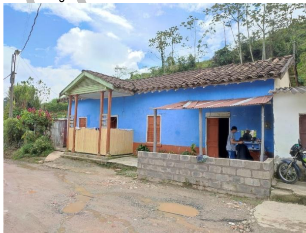
Figura 10. Estación ferrocarril La Quiebra